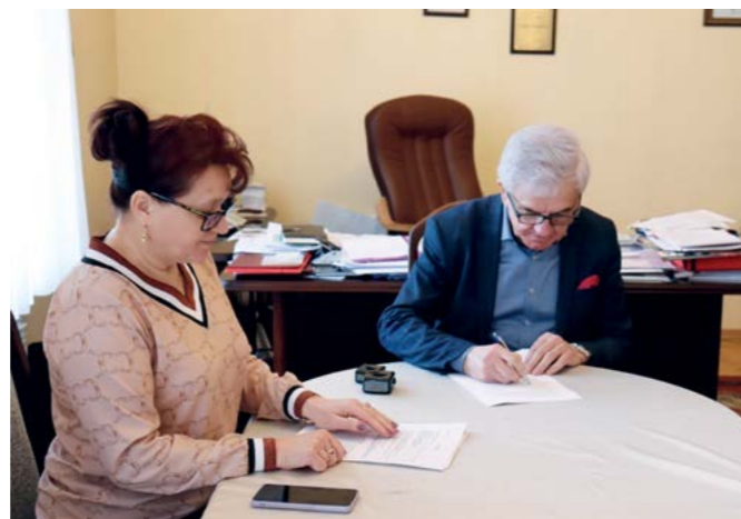
Burmistrz podpisuje umowę, dzięki której niepełnosprawnym będzie łatwiej.

Samochód marki TOYOTA model PROACE VERSO – MY22 został dofinansowany ze środków PFRON w kwocie 120.000,00 zł.