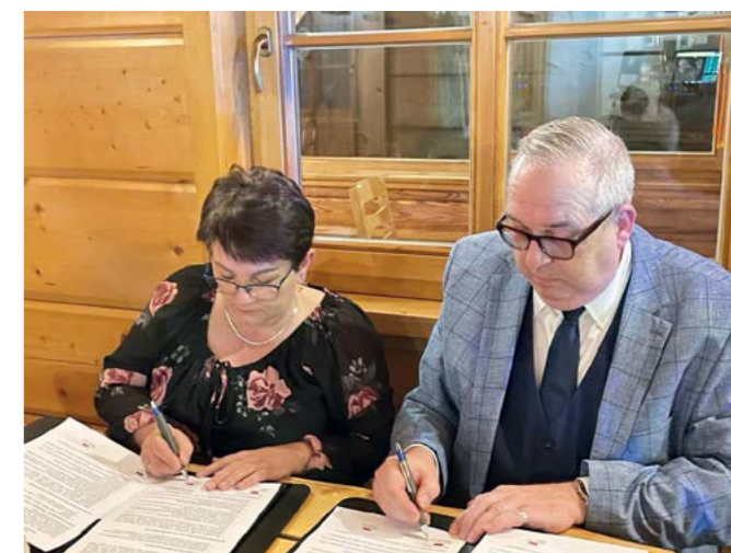
Dyrektorzy szkół podpisują porozumienie

W ostatnim dniu spotkaliśmy się z przedstawicielami naszej partnerskiej Szkoły Podstawowej Rosa-Luxemburg w Neuruppin.