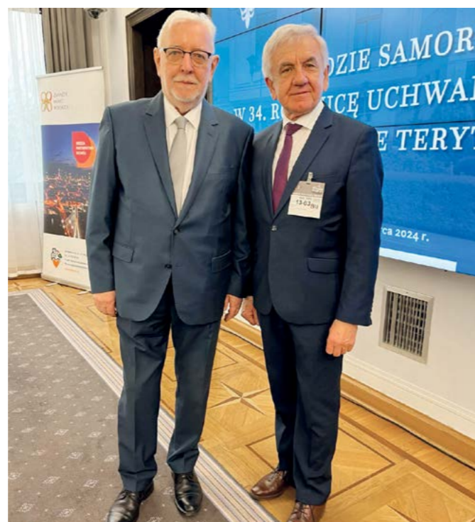
Pamiątkowe zdjęcie z twórcą polskiego samorządu – Jerzym Stępnem.

Możemy być dumni, że w tym gronie był nasz wódzar, pod którego rządami Babimost przeszedł drogę od pogarnizonowej gminy bez perspektyw, po uprzemysłowioną jednostkę, z zerowym bezrobociem, dwiema dużymi fabrykami, regionalnym lotniskiem, obwodnicami i wysokim miejscem w rankingu gmin stwarzającym mieszkańcom dobre warunki do życia.